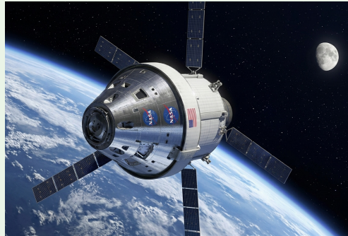
Foto da Nave Orion fornecida pela Nasa

ricos que apontam a ascensão e a decadência de vários impérios na Antiguidade, na Idade Média, na Idade Moderna e no início da Idade Contemporânea. 1